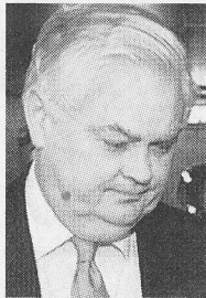
Norman Lamont, före detta brittisk finans- minister.

Liknande uppläxningar drabbade oss flera gånger då vi refererade vad som